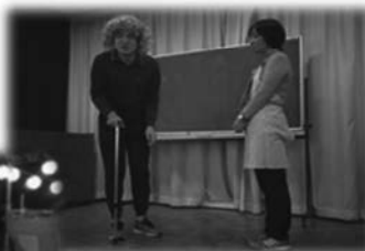
認知症見守り研修会