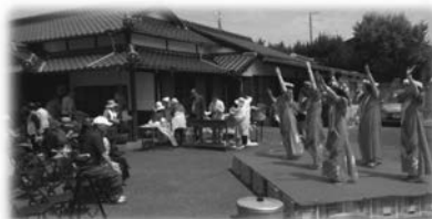
サロン1号 開設イベント