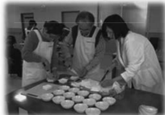
認知症予防の食事作り