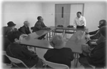
介護施設の見学会