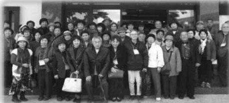
シニアクラブ 日帰り旅行