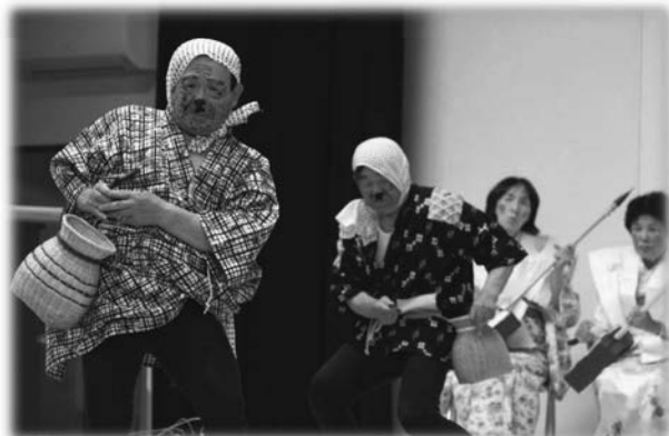
サロン合同ランチショー