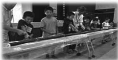
ららら♪kitchen(子ども食堂)