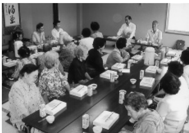
独居老人の昼食招待 (にしやまの里)