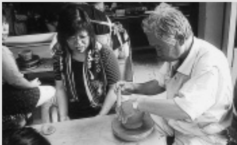
陶芸作品作り（陶芸）