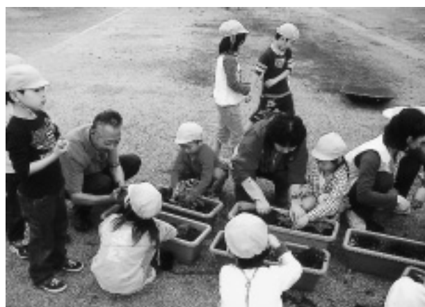
保育所へ花苗配布 (花)